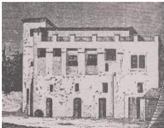
Οικεία Κλεάνθη επί της οδού Θόλου στην Πλάκα, όπου στεγάστηκε το πρώτο Πανεπιστήμιο Αθηνών.

Η παρούσα Πρυτανεία, αναγνωρίζοντας το σημαντικό έργο που όλα αυτά τα χρόνια επιτελείται στο Ιστορικό Αρχείο, αφενός κάνει σχετική μνεία στον Εσωτερικό Κανονισμό και στον Οργανισμό Διοικητικών Υπηρεσιών του Πανεπιστημίου, αφετέρου στηρίζει τις προσπάθειες και δραστηριότητες που εξασφαλίζουν την εύρυθμη λειτουργία του και την επίτευξη των στόχων του και στο μέλλον. Σχετικές πρωτοβουλίες μπορούν μάλιστα να αναληφθούν για μία πιο ενεργητική συμμετοχή του Ιστορικού Αρχείου σε εκπαιδευτικές και ερευνητικές δραστηριότητες αναφορικά με την ιστορία του Πανεπιστημίου Αθηνών και την ιστορία της Ανώτατης Εκπαίδευσης, σε συσχετισμό πάντοτε με τους πολιτικούς, κοινωνικούς, ιδεολογικούς και πολιτισμικούς παράγοντες στην Ελλάδα και σε άλλες χώρες.