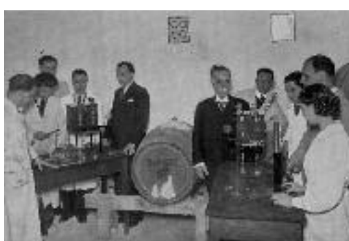
Πρότυπο οινοποιείο του Εργαστηρίου Οργανικής Χημείας.