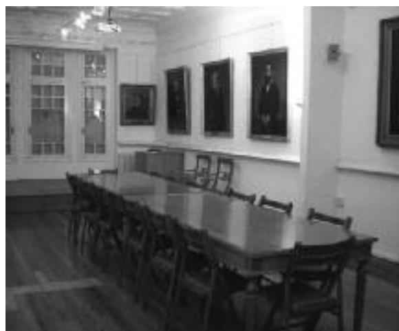
Η αίθουσα εκδηλώσεων του Ιστορικού Αρχείου.