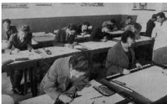
Αίθουσα ασκήσεων του Εργαστηρίου Μηχανολογίας και Σχεδίων.