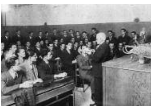
Αίθουσα διδασκαλίας του Γεωλογικού και Παλιοντολογικού Εργαστηρίου.

ΕΘΝΙΚΟ ΚΑΙ ΚΑΠΟΔΙΣΤΡΙΑΚΟ ΠΑΝΕΠΙΣΤΗΜΙΟ ΑΘΗΝΩΝ