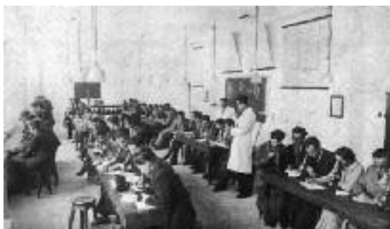
Αίθουσα ασκήσεων Εμβρυολογίας και Ιστολογίας.