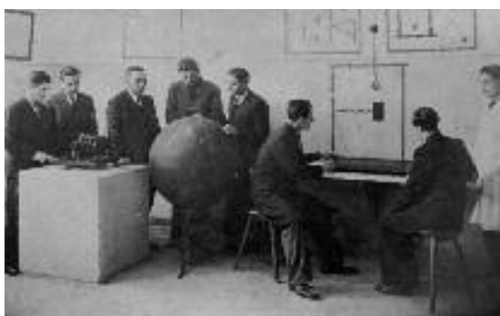
Αίθουσα ασκήσεων του Εργαστηρίου Σεισμολογίας.