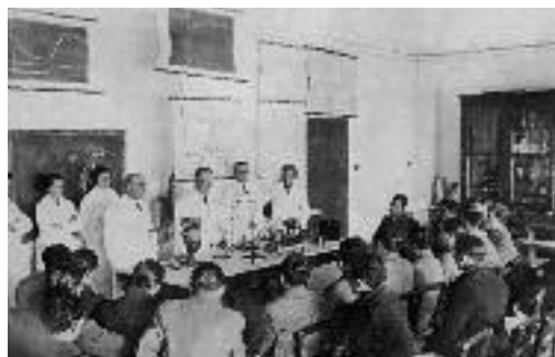
Αίθουσα πειραματικής διδασκαλίας του Φυσιολογείου.